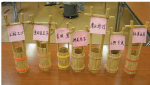
出来上がった作品

講座だより 9月27日（土）からわらわら細工講座が始まりました。第一回はわらで花瓶をつくりました。次回以降はミニわら草履や、正月用の輪かざりなどを予定しています。