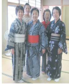
舞踊クラブみのり会の皆さん