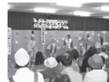
「だれでもなんでも展」 保育室交流会の様子の様子

大集会室:定員90名 小集会室:定員25名 学習室:定員15名 和室:定員40名