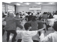
第30回白梅利用者発表会の様子