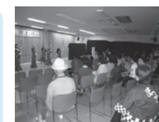
第12回本館まつりの様子

第1集会室:定員12名 第2集会室:定員20名 第3集会室:定員40名 第4集会室:定員30名 第5集会室:定員70名 第6集会室(和室):定員15名 第7集会室(和室):定員15名 第8集会室:定員10名 調理室:定員20名 美術室:定員20名 音楽室:定員30名 視聴覚室:定員30名 児童室:定員25名 展示スペース