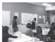
保育室併設講座の様子の様子