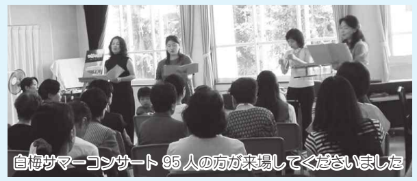
白梅サマーコンサート 95人の方が来場してくれました