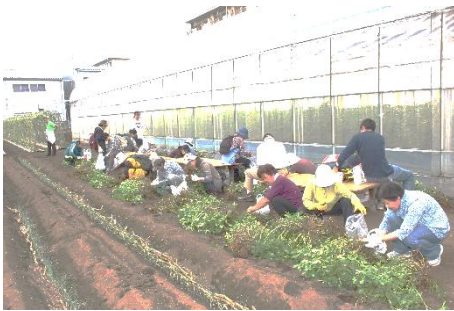
落花生ウォークの様子

今年度もJAにしたまと協力し、9月末に「落花生ウィーク」を実施しました！ どのイベントも大盛況！今後もはっ！ピー☆ナッツをよろしくお願いします！