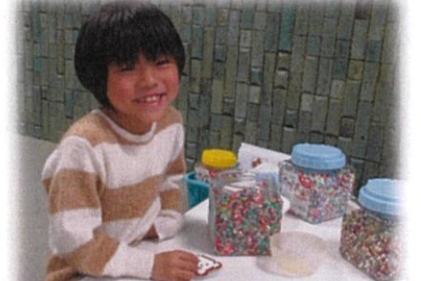
アイロンビーズをつくろう