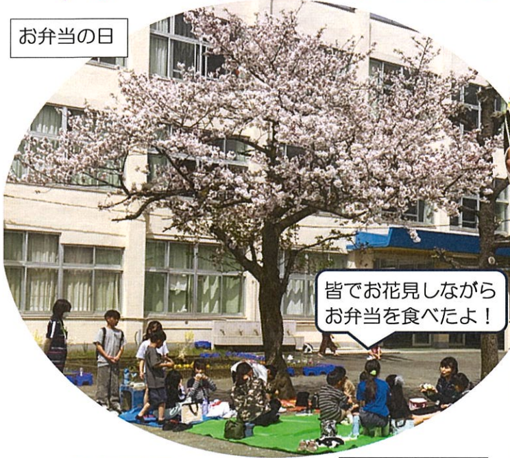
皆でお花見しながら お弁当を食べたよ!