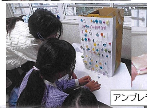
アンブレラマーカーを作ろう