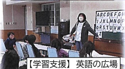
【学習支援】英語の広場

お世話になった6年生に メッセージカードとプレゼントを みんなで渡しに行きました！