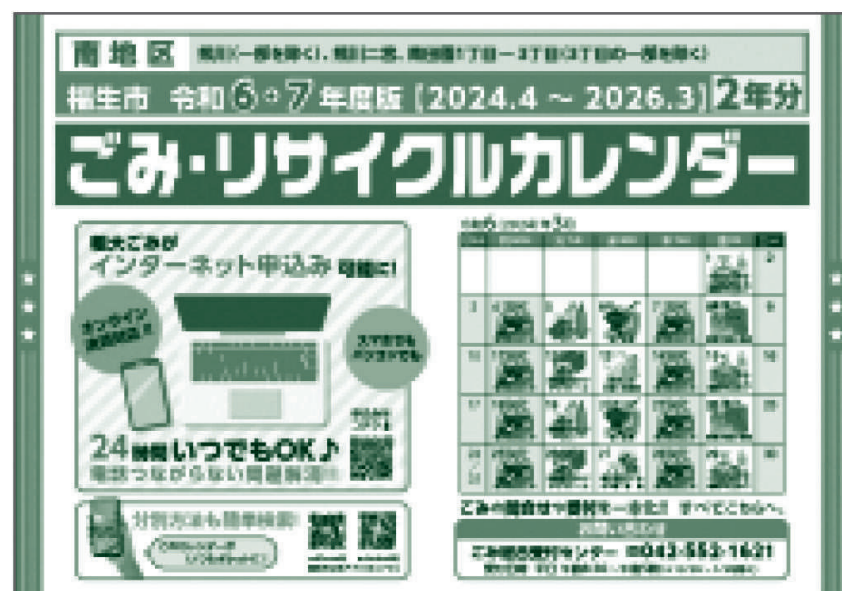
ごみ・リサイクルカレンダー(南地区)

2世帯同居などで2部以上必要な方、共同住宅版や英語版が必要な方は、市ホームページや市公式アプリ「ふくナビ」から閲覧等するか、市役所第二棟2階ごみ減量対策課窓口で配布して