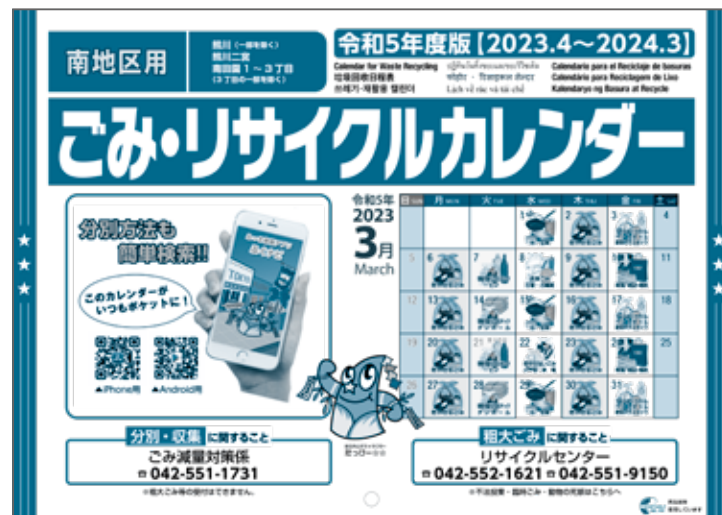
ごみ・リサイクルカレンダー(南地区)

*英語・韓国語・中国語・ポルトガル語・スペイン語・タイ語・ベトナム語・タガログ語・ネパール語