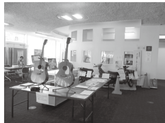
▲ 福生市での下見会の様子

また、福生市では東京都や西多摩地区の自治体と連携し、インターネット公売の合同下見会に参加しています。