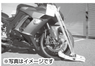
▲ バイクのタイヤロック

福生市は徹底した財産調査(23,654件)のもと、平成29年度には9件のタイヤロックと、17件の搜索を実施しました。