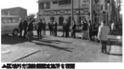
▲区域外市道認定申請書の審査

三 認定停止するもの 問 七社が許可を申請してくる可能性はあるか。 答 認定停止するもの