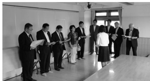
▲わらべつくし保育園を視察