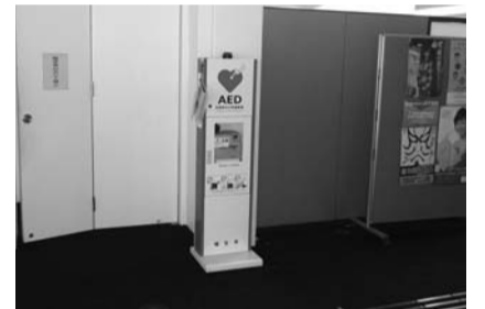
▲市役所に設置しているAED

の保健分野の授業でAEDの取り扱い方を学習するが、同学年を対象に救急救命講習を予定している学校もある。