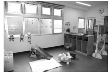
▲福生保育園の病後児保育室

定としている。財政負担等の問題、民間サービスの状況等から総合的に判断し検討していきたい。