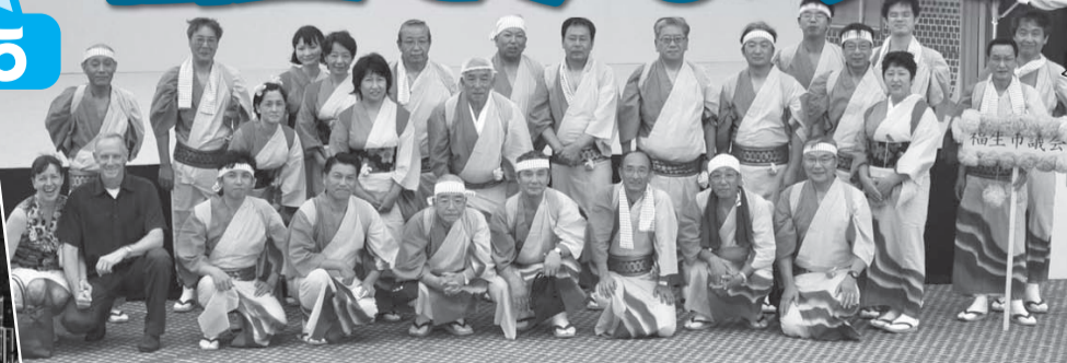
▲昨年の七夕まつり民踊パレード参加風景