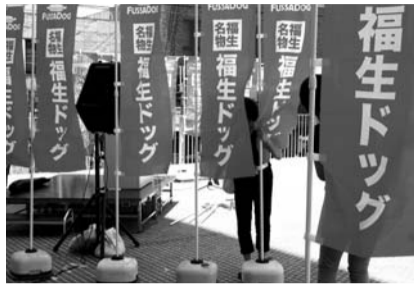
▲福生ドック出陣式

の新規雇用を生み出したことで、地域雇用の改善や地域経済の活性化等が図れたと思う。