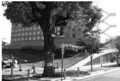
▲市役所前に設置されているカーブミラー

行なう等について関係者の理解・協力を得て、道路の見通しがよくなるよう改善、確保を図っていきたい。