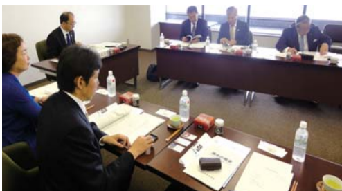
▲兵庫県赤穂市の都市景観について視察

視察先 ①兵庫県加西市 ②兵庫県赤穂市 視察日 平成26年5月14日(水)～5月15日(木) ③第三セクターで運営の北条鉄道は、加西市のほ