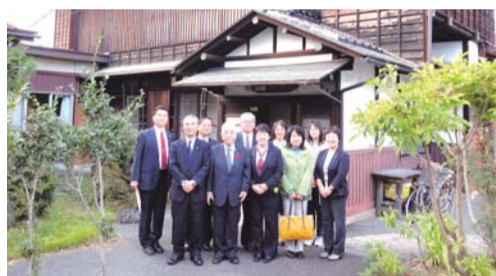
▲岩手県奥州市の「思い出カフェ」を視察

ほ中心にある北条町駅以外(7駅)は無入駅で、現在の旅客割合は、50%が市内外に通学される学生。通勤などの利用は10%以下だが、公共交通を良くしなければ、まちの衰退につながるといふ考えのもと、ボランティア駅長、イベント列車などの施策を展開。我が市においてもこうした動脈となる鉄道を住民参加で盛り上げることはプラスになると感じました。