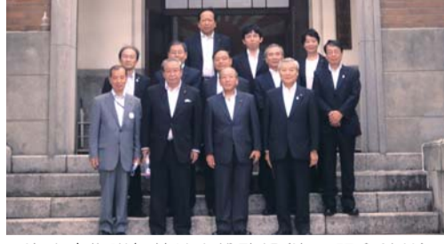
▲海上自衛隊舞鶴地方総監部(海軍記念館前)

視察日 平成26年6月25日(水)～26日(木) 舞鶴市は、戦前は旧帝国海軍と共に、戦後は昭和27年に海上自衛隊の基地が開設され発展した。現在、舞鶴地方隊には航空基地や海上訓練指導隊、教育隊などの施設があり隊員数は市人口の4・1%にあたる約3千7百人が駐留。国からの基地交付金は、福生市の10%にあたる約1億6千3百万円。その他、当市同様防衛補助事業(8条)助成、特定防衛施設周辺整備調整交付金(9条)の交付を受けている。