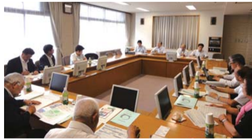
▲岐阜県美濃加茂市の「みのかも定住自立圏共生ビジョン」を視察

の深い周辺市町村と地域全体で、人口定住に必要な生活機能の確保に取り組み、特別交付税で財源措置される。市は、周辺7町村と平成21年から協定を結び、「みのかも定住自立圏共生ビジョン」