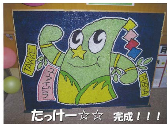
たっけー☆☆巻紙アート