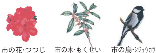
市の花・つづじ 市の木・もくせい 市の鳥・ジュウカウ