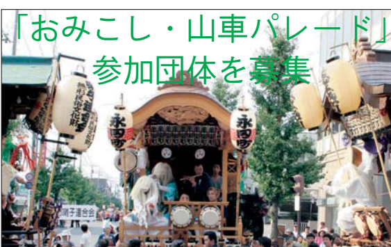
「おみこし・山車パレード」参加団体を募集

されます。我こそは織姫と思われたい方、お祭りが好きな方、あなたの夢をまた一つ、織姫コンテストで叶えてみませんか。