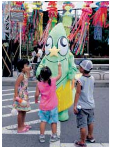
七夕まつりオリジナルキャラクター「たっけー☆☆」