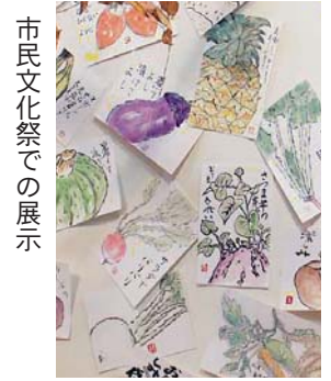
市民文化祭での展示