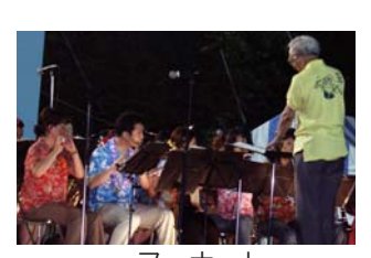
フィナーレ。市長が吹奏楽団を指揮