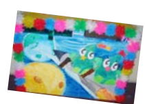
青少年海外派遣OBの七夕飾りたっけー☆☆宇宙