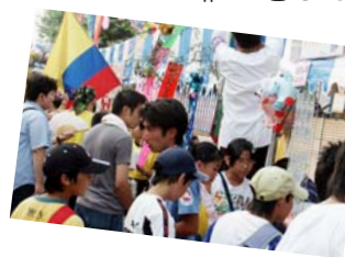
にぎわう市民模擬店