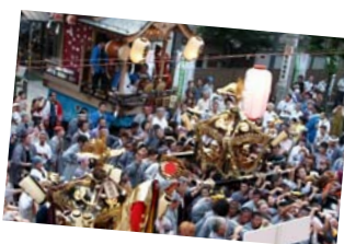
山車みこしパレード