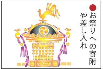
●お祭りへの寄附 や差し入れ

28日の水曜日午後3時～ 場所 中央図書館 対象 幼児～小学生 ※直接どうぞ 中央図書館小学生向けおはなし会 「おはなしのポケット」 出演 ポケット☆ポケット 日時 1月10日(土)午後3時 場所 中央図書館 対象 小学生 ※直接どうぞ 問合せ 中央図書館 ☎553・3111 わかぎり図書館おはなし会 日時 1月8日(木)午後3時30分 場所 わかぎり図書館2階 対象 幼児～小学生 ※直接どうぞ わかぎり図書館乳幼児向けおはなし会 日時 1月28日(水)午前11時～ 問合せ わかたけ図書館 ☎551・0083