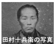
田村十兵衛の肖像画