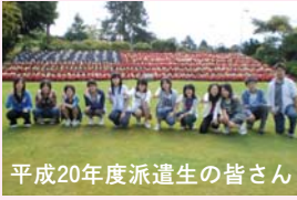
平成20年度派遣生の皆さん

応募資格 ①福生市に引き続き1年以上住んでいる(平成21年4月1日現在)方で、学校教育法に基づく中学校第一・二学年(平成21年3月1日現在)に在学していること②本事業による海外派遣の経験がないこと③心身ともに健康で協調性があり、規律ある団体生活ができること④派遣後もこの経験を生かし、学校や地域において積極的に活動できること⑤事前・事後を含め、全ての研修に参加できること⑥保護者の承認が得られること