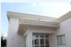
わかたけ会館・図書館が新しくなりました

【申込み】4月17日(金)から電話または直接、わかたけ図書館 ☎ 551・0083 へ。