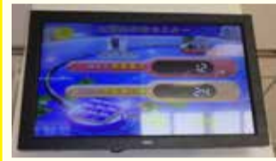
太陽光発電モニター

施設の改築を行い、太陽光発電設備を屋上に設置しました。この設置により、電力使用量の約8%の削減効果が出ています。また、館内の太陽光発電モニターで発電電力量が確認