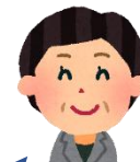
推進校 小学校校長

中学校教員の学年での対応の仕方や副担任制度等を取り入れたところ、これまで以上に学年組織を意識して児童へ指導するようになりました。中学校と小学校のよさが組み合わせたり、学校が活気付いています。