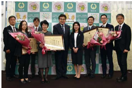
▲文部科学大臣優秀教職員表彰を受賞

学校教育における教育実践等に顕著な成果を上げたとして「令和4年度文部科学大臣優秀教職員表彰」を受賞しました。