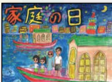
図画【一席】 (三小4年) 森田まひろ