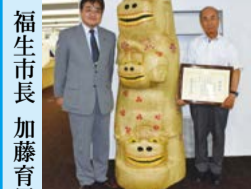
福生市長 加藤育男 彫刻作品「獅子三四」の贈呈式にて