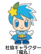
社協キャラクター「福丸」

【対象】65歳以上の市民の方 【問合せ】介護福祉課高齢福祉係 ☎551・1751 ふくふくまつり開催