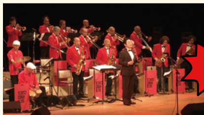
▲東京キューバンボーイズ