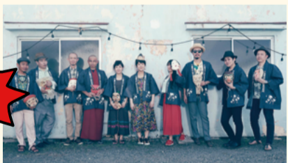
▲民謡クルセイダーズ

日本を代表するラテン・ビッグバンド「東京キューバンボーイズ」と、日本民謡とラテンリズムの融合を次世代に伝える「民謡クルセイダーズ」。ラテンの名曲と日本民謡の世界を総勢30人が奏でる大パノラマ・ラテン・コンサート！