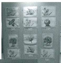
「大人のぬり絵教室」