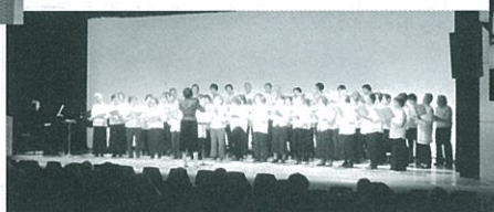
「童謡・唱歌の合唱」