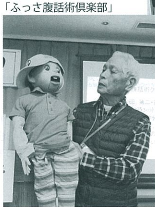
「ふっさ腹話術倶楽部」