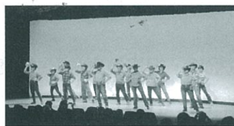
「カントリーラインダンスに挑戦!」