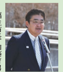
福生市長 加藤育男 ふっさ桜まつりにて