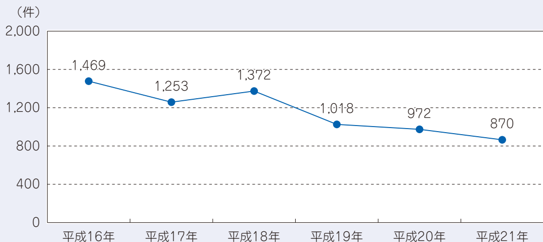
〔市内刑法犯認知件数〕

■「安全安心まちづくり市民ひろば」市民会議を定期的開催し、市民の主体的参加と議論を通じて、地域コミュニティや関係機関等と連携した安全安心パトロールや子どもたちの見守り活動などが実施され、犯罪抑止に効果をあげています。また、「ふっさ防犯だより」を発行し、市民への情報の提供を行っています。更に、平成21年3月には「福生市安全安心まちづくり条例」を制定し、犯罪防止に関する市民、事業者等と行政との責務を明確化し、安全安心まちづくり協議会の設置などを通じて地域ぐるみの防犯活動の取組を推進しています。市民の安全を守り、犯罪を防止するため、市民一人ひとりの防犯意識の向上を図るとともに、地域コミュニティや団体活動と連携した防犯活動体制の構築、また、犯罪が発生しやすい環境を改善していくことが求められています。