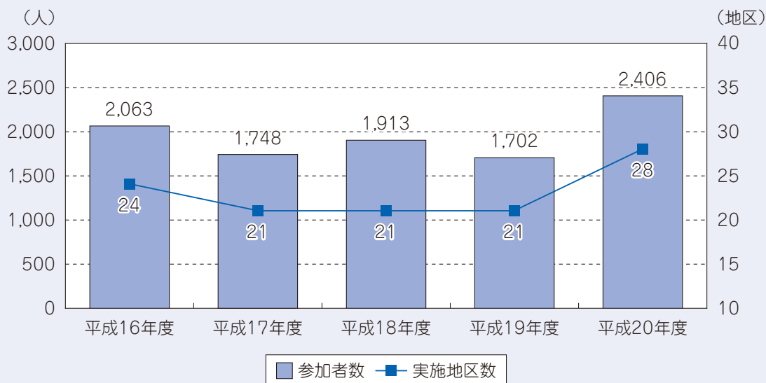
〔自主防災訓練実施状況〕