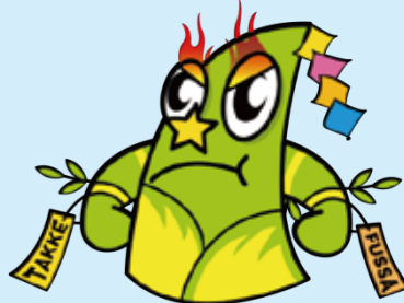
福生市公式キャラクター「たっけー☆☆」