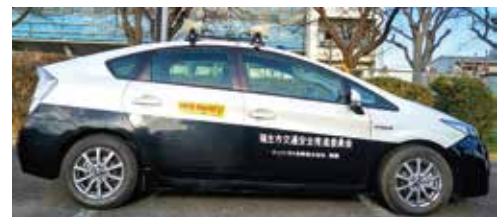
～ 交通安全広報車 ～

【問合せ】福生市 都市建設部 道路下水道課 管理・交通安全対策係 (福生市交通安全推進委員会 事務局) TEL：042-551-1969