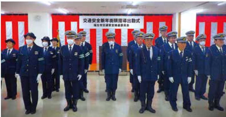
～ 新年街頭指導出動式の様子 ～

福生市が主催するイベント会場の交通整理や交差点で歩行者の安全を守る立哨活動、駅前などで交通安全を呼びかける啓発活動、交通安全広報車両での広報活動など活動は多岐にわたります。交通安全を守る活動に興味をお持ちの方、ご連絡お待ちしております。