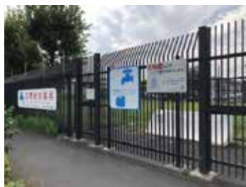
所在地: 武蔵野台二丁目32番地