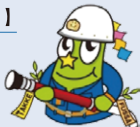
福生市公式キャラクター たっけー☆☆