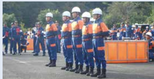
第35回西多摩地区消防操法大会