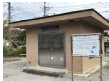
所在地: 南田園一丁目12番地1