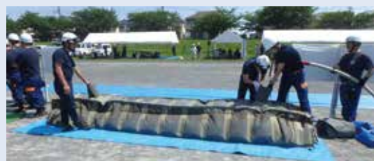
令和7年度福生市・福生消防署合同水防訓練

消防団は、消防組織法に基づき、それぞれの市町村に設置されている消防機関です。消防団員は、常勤の消防職員が勤務する消防署とは異なり、火災や大規模災害発生時に自宅や職場から直接現場へ駆け付け、消火活動等を行う、非常勤特別職の地方公務員です。