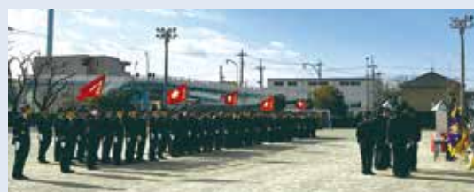
令和8年消防団出初式