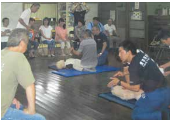
【鍋ヶ谷戸第一町会】応急救護

鍋ヶ谷戸第一地区全戸を対象に、町会独自の「地域防災マップ」を配布する予定でいます。