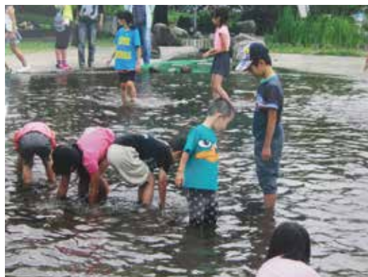
【内出町会】マスのつかみどり

町会行事を重ねる中、地域の親睦の和・安心安全な地域社会・明るく元気な挨拶が交わせる町会作りができればと考えています。