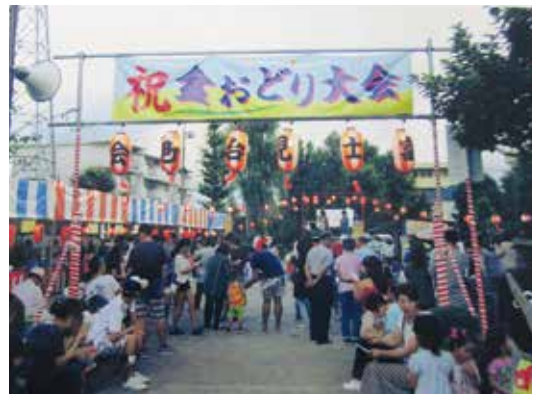
【富士見台町会】盆踊り

このような町会活動から、会員間の連帯感が高まり、人間関係の気持ちの良さ、助け合いの大切さが生まれ、町会として目指して来たものが、少しずつ芽生え始めた様に感じた大会でもありました。