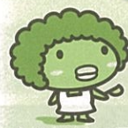
たまちゃんのお母さん