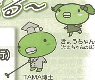
きょうちゃん (たまちゃんの妹)

★日時 平成25年6月2日(日) 午前10時～午後3時(小雨決行) ★場所 多摩川中央公園 げんき広場