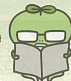
たまちゃんのお父さん

★日時 平成25年6月2日(日) 午前10時～午後3時(小雨決行) ★場所 多摩川中央公園 げんき広場