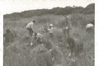
福生水辺の楽校 「カワラノギクをまもろう」

自然環境の保全に関し、顕著な功績があった者(又は団体)を表彰し、これを讃えるとともに、自然環境の保全について国民の認識を深めることを目的に、環境省は平成11年度から毎年度、「みどりの日」自然環境功労者環境大臣表彰を行っています。自然ふれあい部門は、自然とのふれあいに関する各種活動や行事を推進した者等が対象になります。