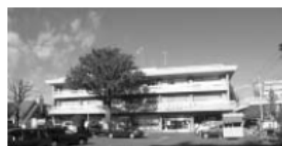
▲建て替えられる現在の庁舎

質問 自主財源が大変厳しい中、目玉押しの大きなプロジェクトで大きな資金を要しているが、調達の資金計画の上、さらに当初予算の一〇％は追加工事等のために備えるべきだが、現在新庁舎の新庁舎の建築費、解体費を含めた資金調達方法について伺いたい。