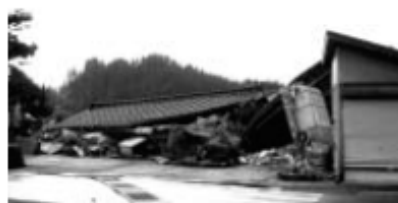
▲耐震診断の形成は (中盤地震で倒壊した家屋)

質問 阪神・淡路大震災では死者の八割強が老朽制度は平成一八年度の物例による圧死で、昭和五六年以前建築の耐震化の重要性が指摘され、多くの市町村で耐震診断等の助成を制度化し、国も地方公共団体が利用できる制度を一七年度からスタートさせているが、市の対応策を伺いたい。