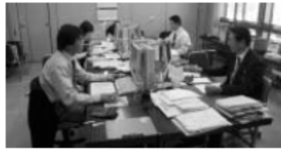
▲平成18年度予算編成中 (財政課)

市長 重要事項では福生駅前再開発、児童館新庁舎建設、新庁舎建設、新福祉事業は児童・生徒の通学路の安全確保のための、二小正門前歩道設置、一中西側市道の拡幅改良や中央体育館附属等施設を予定。ソフト面では国民保護法に基づく市の役割分担の