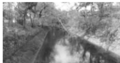
▲川の生息場所 (五川上水宮本橋上流)

市長 地帯の方の飲用状況確認や研究等大変ありがたい。歴史的意義として国の史跡に指定された五川上水を良好に保存するため、東京都水道局は管理計画を策定し、保存及び管理に関する意見募集を募集している。また生育場所の確保等環境整備を進めている。