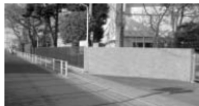
▲歩道が延伸される市道の号線 (第一中学校周辺)

質問 市道三〇号線・福生二中西側は二、三小市民会館等への道路、四道一六号線から御川、押島方面への抜け道など大変利用者が多い。一四年度に歩道が設置されたが、さらに七層階切まで延長すると歩行者の安全が大きく確保されるが、その後の維持状況はどうか。