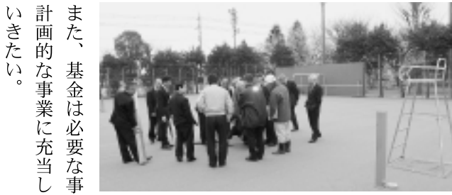
▲武蔵野台テニスコートを視察