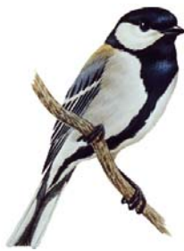
市の鳥・シジュウカラ