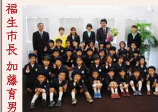
福生市長加藤育男 勤労感謝の日になみ福生多摩幼稚園園児の表敬訪問を受ける市長