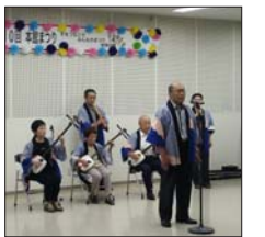
本館まつりの様子

本館まつりは、日ごろから公民館本館を利用するサークルの皆さんが主体的に作り上げているおまつりで、今年で12回目の開催になります。公民館本館サークルの日ごろの活動をお楽しみください。