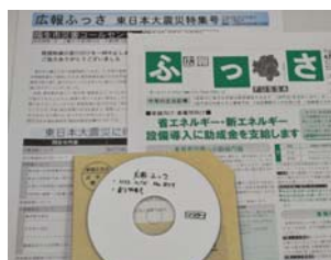
広報ふっさの記事を全て聞くことができます。