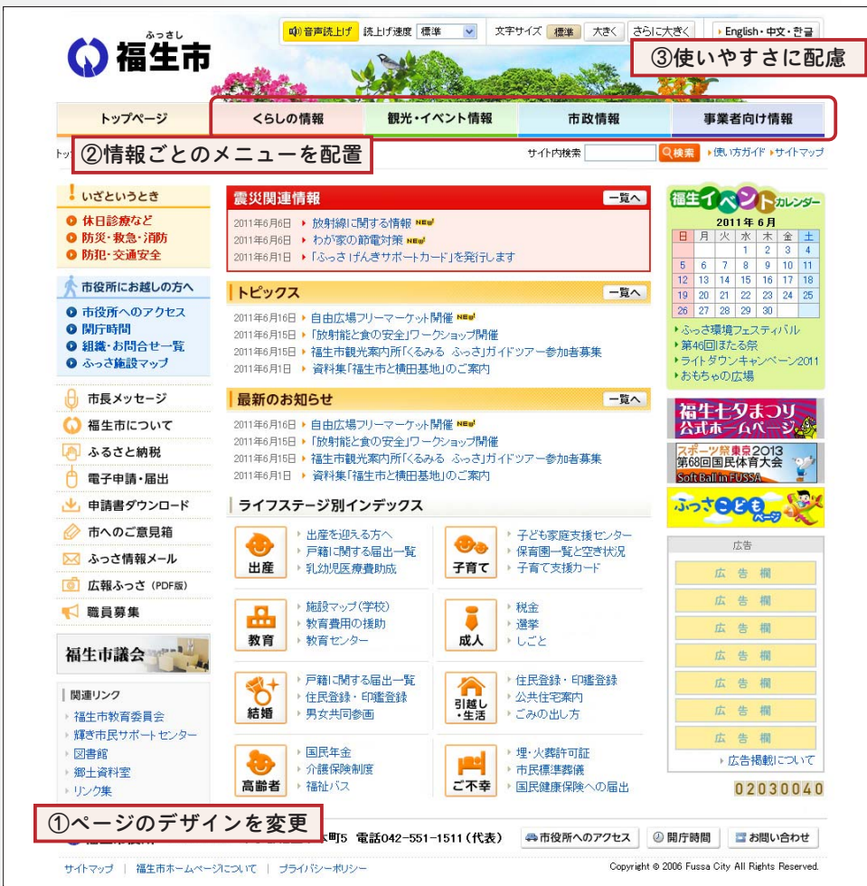
新しい福生市ホームページトップページ