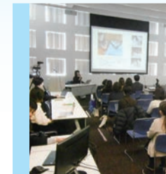
▲ときようすくわくプログラムシンポジウムの様子

倍、産婦の3人に1人が利用。伴走型相談支援と連携し、本事業は保健師と面談後に支援プランを作成、助産所や医療機関と情報共有し定期的に支援している。利用申請件数が増加し受入先の確保に苦慮していることから、新たな受入先を加え計5か所に対応している。