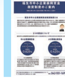
▲融資制度に関するパンフレット

市長 令和6年度から創設する長寿ふれあい食堂運営費補助金は、地域の高齢者が会食を通じて交流する場の創出を支援するもの。地域における緩やかな見守りで孤独感の解消、また、スタッフとして参加していただくことで高齢者の生きがいの増進に繋げていきたいと考えている。