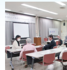
▲男女共同参画セミナーの様子

ら認識が浸透するよう図った。市内公共施設並びに駅前公衆トイレ等に「福生市女性等悩みごと相談カード」を設置するなど、気軽に相談できる専門電話、LINE相談などを紹介している。性的少数者に寛容な社会の実現に向け、引き続き知識の普及啓発及び支援の充実に努める。