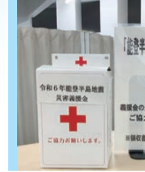
▲市庁舎で行っている災害義援金受付

教育長 市立学校における教科書採択は、法令に基づき福生市教育委員会の責任と権限で行うものであり、採択に当たり公正性と透明性を確保し、適正な採択事務を進めていく。