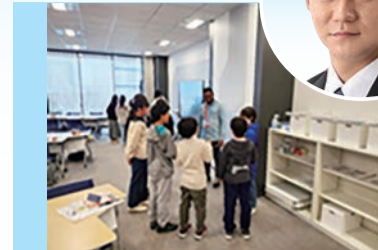
▲東京グローバルゲートウェイ・グリーンズプリングスでの学習の様子

みを推進している。これらの取り組みにより、令和5年度GTECの結果では本市の平均スコアが全国平均を上回るなど、一定の成果につながったと捉えている。今後、教員の英語力と英語指導力を一層向上させるため各校に英語教育専門家を派遣するなど、英語教育を推進していく。