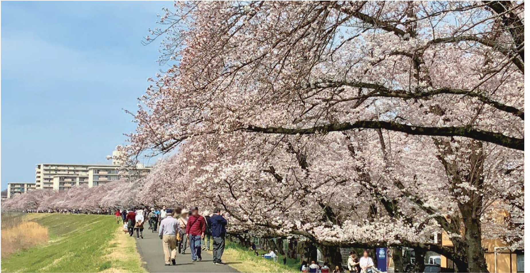
▲多摩川土手沿いの桜