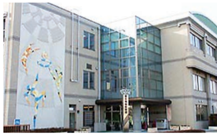
▲ワクチン接種会場として使用した福生地域体育館