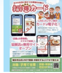
▲ふっさ子育てまるとくカードリニューアルのお知らせ

サイトを開設する。登録申請がスマートフォン等ででき、各世帯で複数カードを作るなど市民の利便性向上につながることや事務処理の効率化、さらに専用サイトで簡単に店舗検索や店のPRもできるようになるため、市民、協賛店、行政の三者共に大きなメリットになると考える。