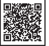
▲福生市議会HP (通告一覧へリンクします)