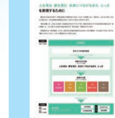
▲第5期福生市総合計画(抜粋)

術の活用を図ってきた。現在も物価高騰は収まる気配がなく、福生駅西口地区市街地再開発事業や福生駅東口地区富士見通り線整備事業は、コロナの影響で道半ばの状況であり、熟慮を重ねた結果、私自身の手でこの難局を突破し、福生市政を次代につなげていきたいと考えている。