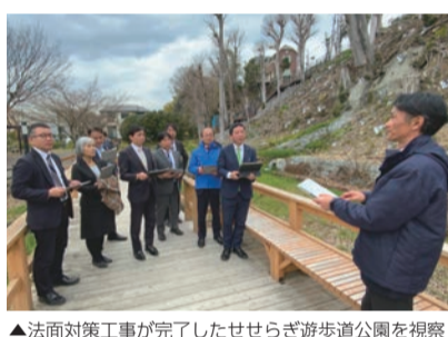
▲法面対策工事が完了したせせらぎ遊歩道公園を視察

3月12日に委員会が開催され、3件の議案を審査し、原案のとおり可決されました。継続審査となっていた陳情1件は、不採択となりました。