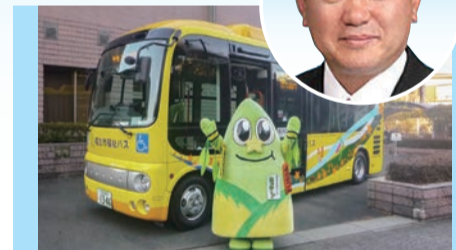
▲たなばた号出発式の様子

の向上等を図るため、牛浜駅東口や中央図書館をルートに加えた中央コースたなばた号を導入した。新コース導入直後の1か月間の利用状況は、3コースを合わせて約8200人で、1日当たり約280人が利用し、今後も利用者の増加を見込んでいる。引き続き周知と安全運行に努めていく。