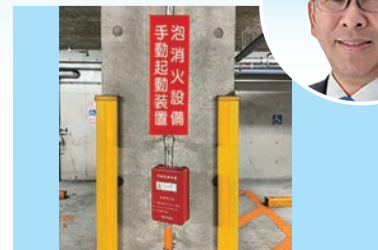
▲PFOSを含有していない泡消火設備

い、あるいはかえって火災を拡大させる恐れがあるため、市庁舎の地下駐車場に泡消火剤を使用しているが、PFOSは含有していないことを確認している。また、その他の施設で泡消火剤は使用していない。今後もPFOSの規制については、国等の動向を注視し、適正に対応する。