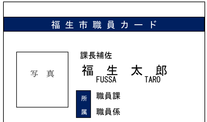
▲旧デザイン（～令和6年3月31日）