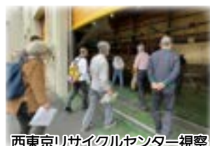
西東京リサイクルセンター視察

ふっさ環境市民会議とは、市民と環境行政との架け橋をスローガンに、身近な環境問題や地球温暖化防止に向けた啓発活動と情報発信を行い、環境にやさしいまちづくりを推進している市民団体です。