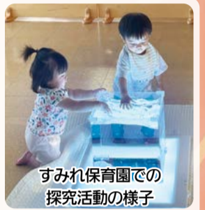
すみれ保育園での探究活動の様子