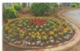
▲一般の部最優秀賞 本町第八第一町内会