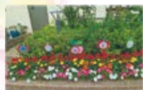
▲学校の部最優秀賞 すみれ保育園