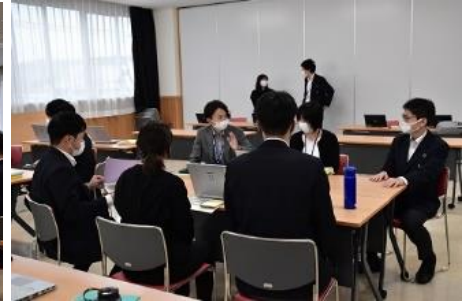
チームごとに議論