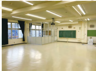
▲開設に向けて現在準備中です！

令和5年4月から、第一小学校内に新たに「臨時スマイルクラブ」を開設します。 入所を希望される方や希望クラブを変更される方は、上記の学童クラブ第2次申請受付期間内に申請してください。 【名称】臨時スマイルクラブ ※「スマイル」という名称は、第一小学校の児童の投票で決まりました。 場 第一小学校2号館(福生1055)