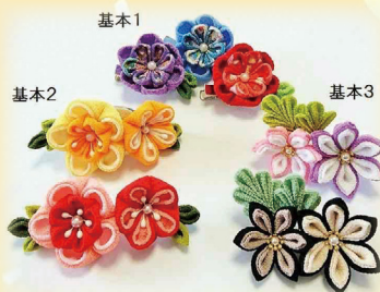
▲つまみ細工の種類

「つまみ細工」とは、小さな正方形の布を「折り」、「つまみ」、複数を組み合わせて糊付けし、花や蝶を形作る技法です。