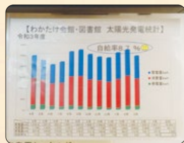
▲わかたけ会館・図書館の掲示物

2月14日(火)・16日(木)に、各部署・施設で環境監査と優良取組選定を実施します。公共施設を利用される皆様のご理解、ご協力をよろしくお願いいたします。