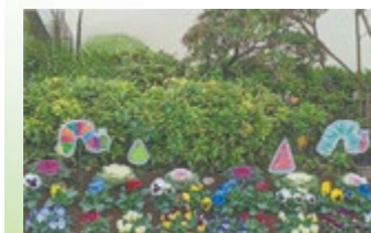
▲学校の部最優秀賞 すみれ保育園