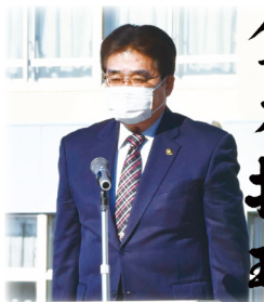
令和 5 年福生市 消防団出初式にて