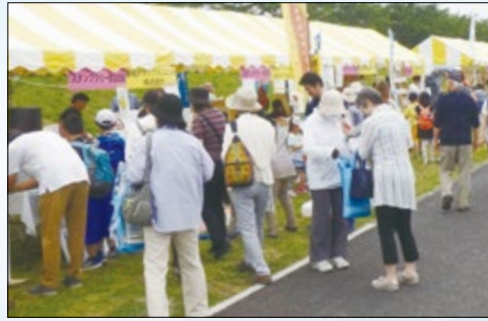
▲来場型イベントのイメージ