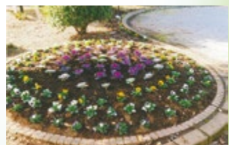
▲一般の部最優秀賞 本町第八第一町内会